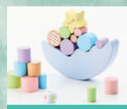
ドリーミームーン