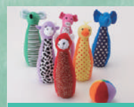
ソフトボーリング