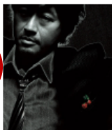
明日晴れるかな 桑田 佳祐